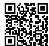
連絡メール2 保護者ログイン

学校・お子様の追加やその他登録内容を変更する場合 右記の「保護者ログイン用二次元コード」を読み取り、保護者サイトに接続します。 * その際、登録したメールアドレスとログインパスワードを入力します。 * 保護者サイト https://renraku.education.ne.jp/parent/ パスワードを忘れた場合 上記登録と同様に空メールを送信すると、パスワードの再設定ができます。 * 保護者登録しているメールアドレスがご利用できない場合は、パスワードの再設定ができません。